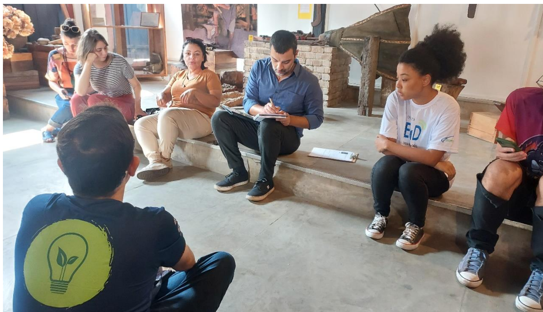
Equipes Sondar, Semente e do Museu Público Municipal Memorial do Tropeiro e Ferreiro Data: 05/09/2024