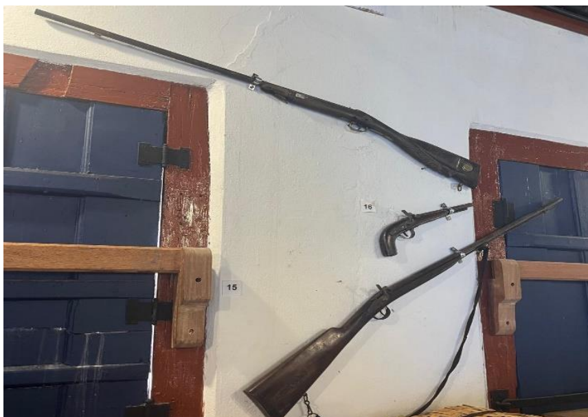
Local onde estava exposta a garrucha desaparecida.

Durante a manhã, as equipes do projeto SONДАР e do Semente começaram suas atividades com uma visita ao Memorial do Tropeiro e Ferreiro, equipamento da Secretaria Municipal de Cultura de Diamantina. No local, as equipes foram recebidas pela equipe de curadoria do museu, que reportou, por meio da plataforma SONДАР, o desaparecimento de uma garrucha, acervo do museu, em outubro de 2023. Os profissionais tomaram conhecimento da plataforma SONДАР em uma das oficinas da primeira fase do projeto, que havia acontecido pouco antes do ocorrido no município do Serro.