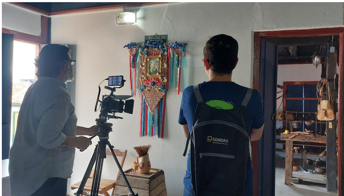
Produção de conteúdo de divulgação do SONDAR