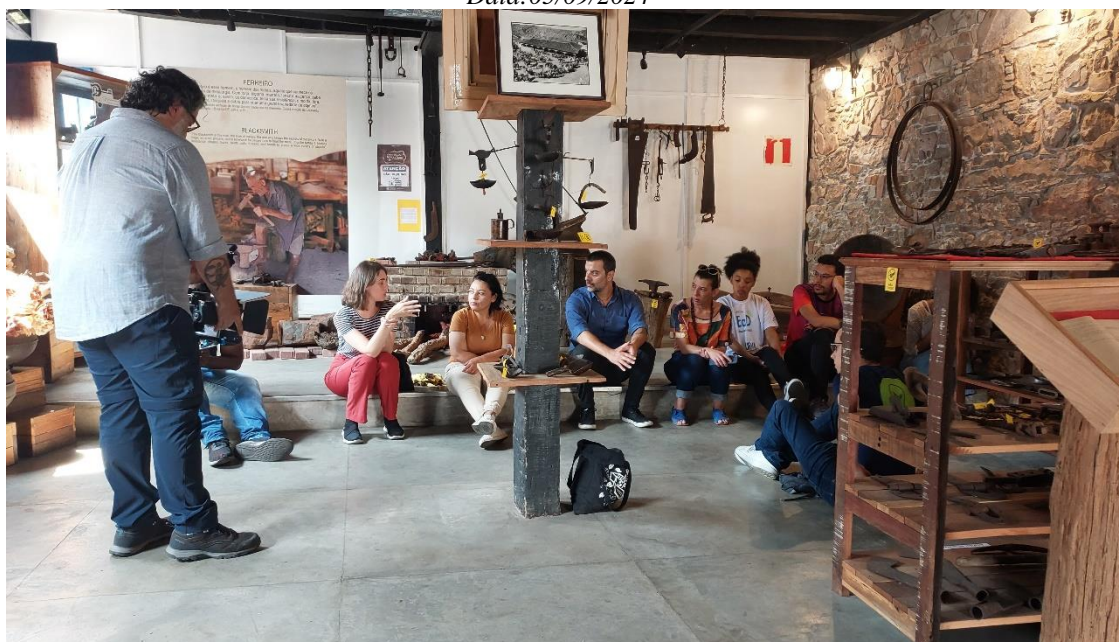
Conversa e produção de conteúdo de divulgação do SONDAR