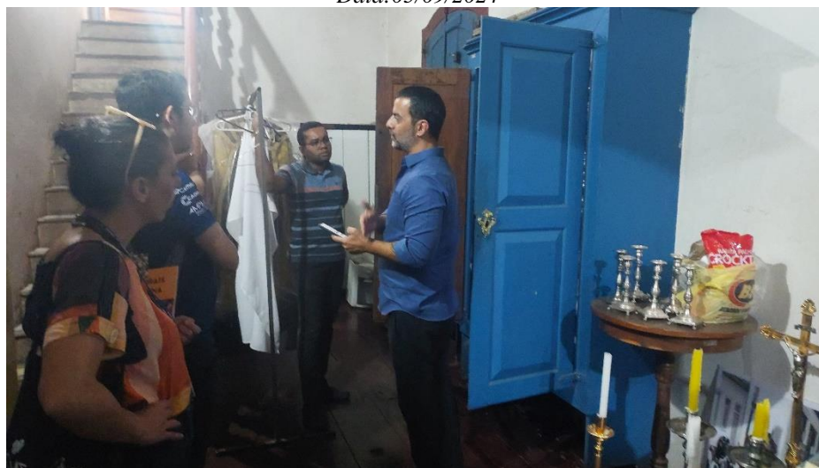
Tentativa de identificação de bem desaparecido Autoria: Maria Letícia Ticle Data: 05/09/2024

Ao final das atividades, a equipe do Semente questionou novamente ao secretário da paróquia e também à equipe da Secretaria de Cultura Municipal como se deu o contato da produção do projeto, pois notou-se uma diferença entre a recepção no Museu e a na paróquia. Foi esclarecido que o contato se deu diretamente com o Gabinete da Prefeitura Municipal por e-mail uma semana antes do início das atividades. O Gabinete, então, encaminhou para a Cultura, que por sua